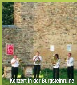
Konzert in der Burgsteinruine

Die Ruinen der beiden nebeneinander stehenden Kirchen am Burgstein sind ein einmaliges Baudenkmal des Mittelalters. Zwischen ihnen verlief die Grenze der Bistümer Bamberg und Naumburg. Als Wallfahrtskirchen wurden sie Ende des 15. Jhs. geweiht. Heute finden in den Ruinen verschiedene Veranstaltungen wie Konzerte, Theater und Märkte statt.