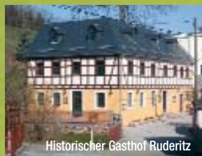
Historischer Gasthof Ruderitz

In den Dörfchen Krebs und Ruderitz erwarten den Wanderer sehenswerte denkmalgeschützte Gebäude, den Historischen Gasthof Ruderitz und zwischen beiden Orten im romantischen Kemnitzbachtal die Kienmühle .